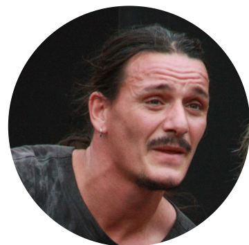
ANGELOS MATSAKIS Auteur & Interprète

Après avoir essayé le ping-pong, l'équitation, le rugby, le badminton, la danse de salon, les échecs, la natation synchronisée, Angelos découvre enfin une activité pour laquelle il est destiné: Le Cirque.